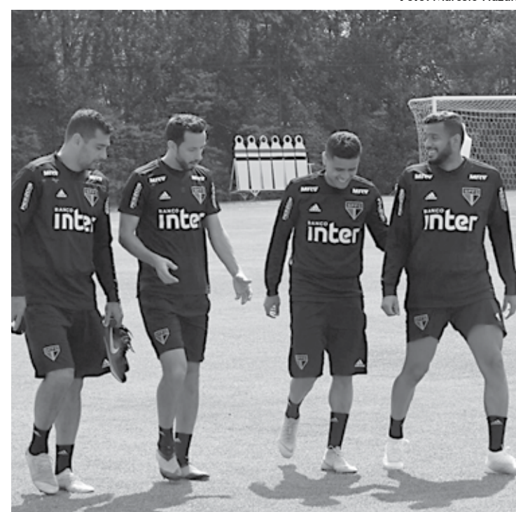
Jogadores do Tricolor descontraindo em treinamento no CT do time paulista

Fechando o pódio dos seis primeiros colocados na tabela que mais pontuaram no retorno estão