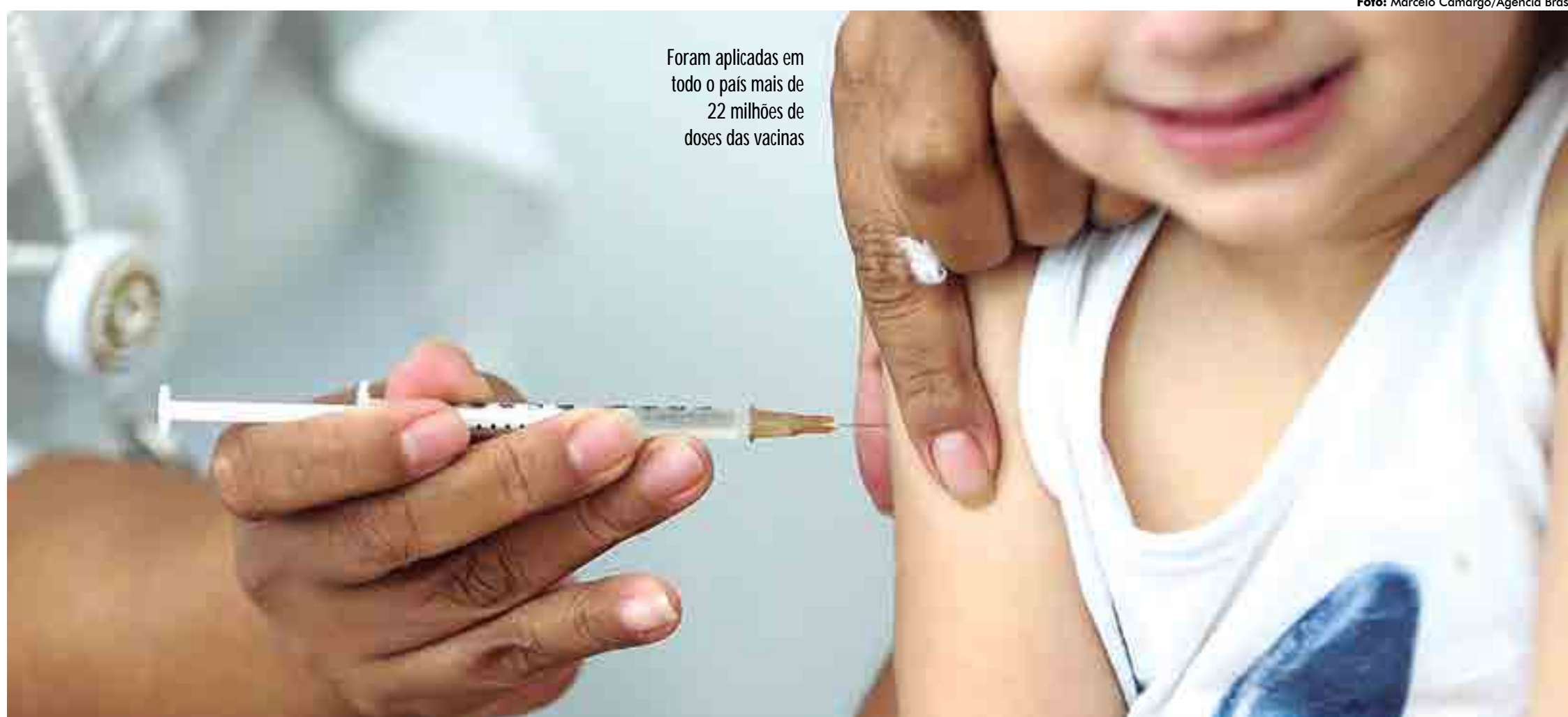
Foram aplicadas em todo o país mais de 22 milhões de doses das vacinas