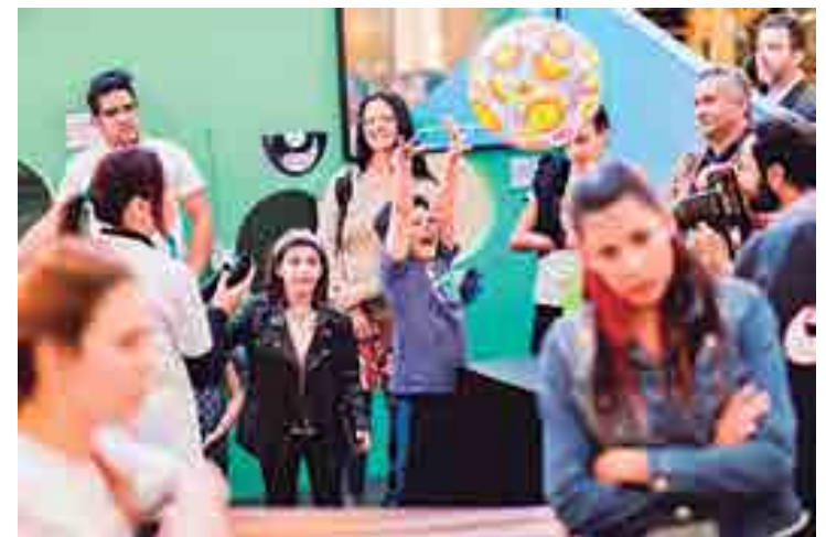
Incêndio do Museu Nacional traz à tona a importância da temática

A perda do acervo do Museu Nacional do Rio de Janeiro é irreparável e motivo de tristeza para o Brasil e o mundo. "A ciência é de todos e para todos. Não deve ser praticada, em sentido amplo, apenas por cientistas, mas por todos os cidadãos. É necessário um esforço generalizado, de cientistas e não cientistas, para facilitar o acesso à ciência, seja em grandes museus ou em pequenas iniciativas locais, contribuindo para a sua disseminação. Só assim vamos ver museus cheios o ano todo e,