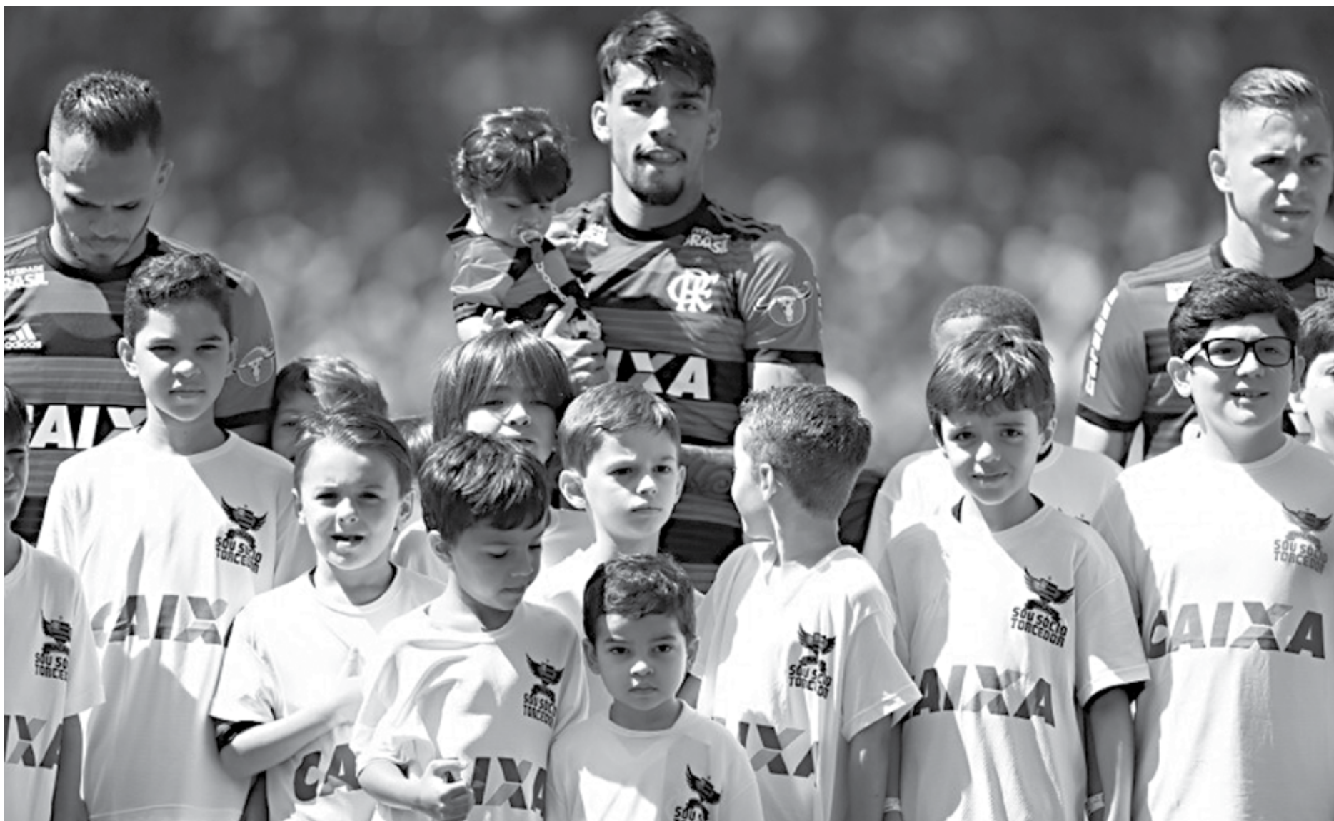
Lucas Paquetá (C) continua sendo cobiçado pelo mercado europeu e clubes como Barcelona, Real Madrid, Paris Saint Germain e Milan preparam uma proposta para tirar o jogador do Flamengo

Dos brasileiros, dois apareceram na lista: Fabinho, transferido do Monaco ao Liverpool por 19 milhões de euros (R$ 90 milhões) a menos do que valeria de acordo com a projeção e Alisson, que deixou a Roma e também foi atuar nos Reds, vale 7 milhões de euros (R$ 33 milhões) a mais do que foi pago.