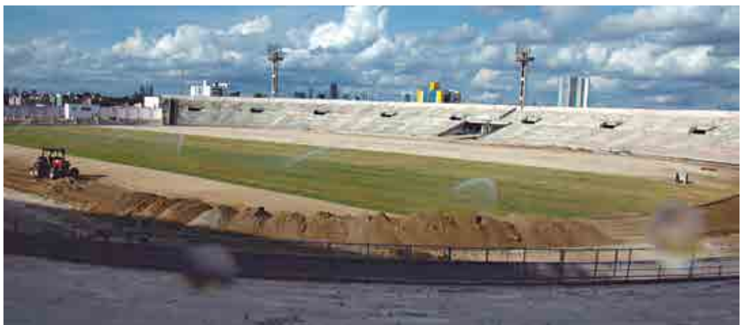
O Governo do Estado está investindo R$ 1,38 milhão na colocação de um novo gramado e no sistema de irrigação e drenagem de alto nível no Amigão

“Mesmo que venha a faltar água na rede da Cagepa, o estádio terá condições de suprimento por uma semana. E