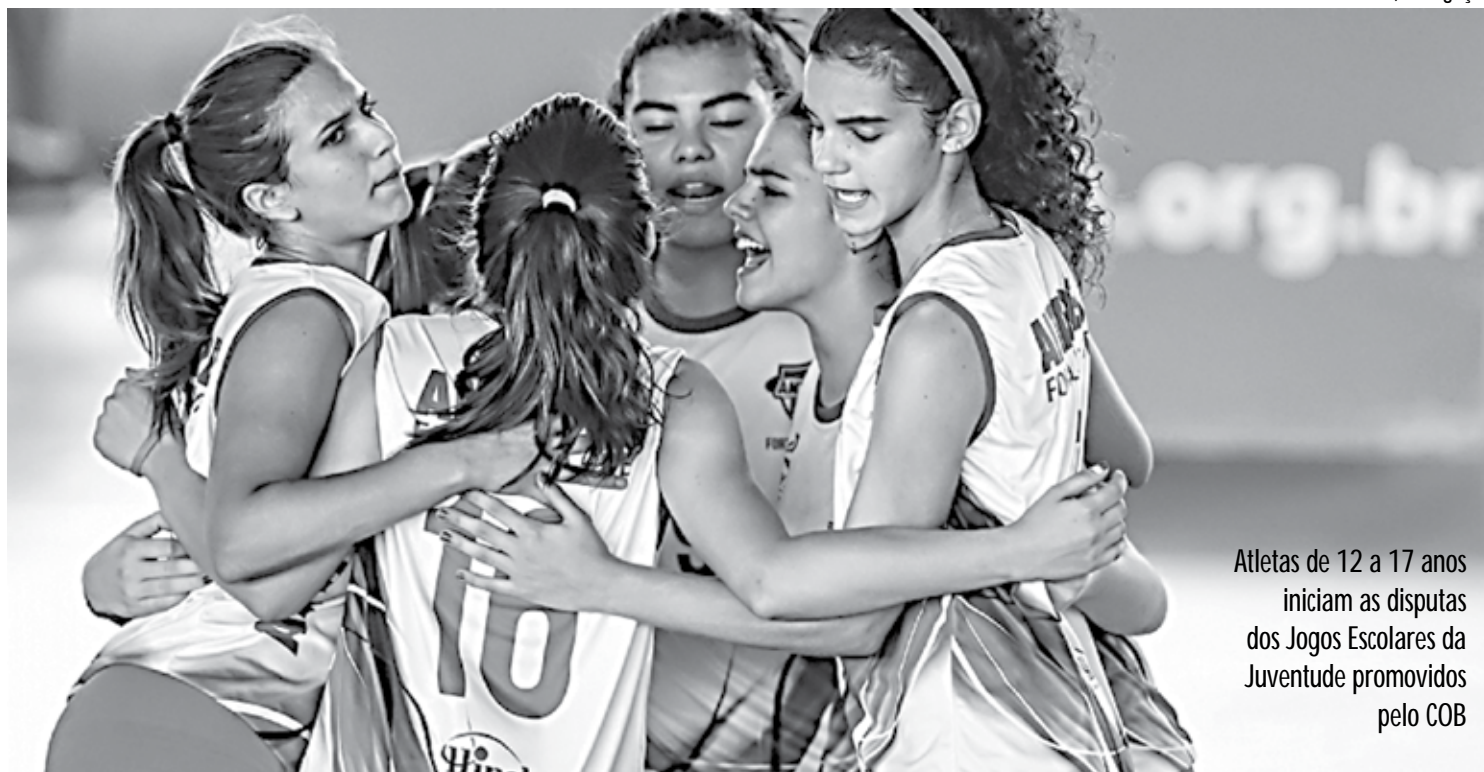
Atletas de 12 a 17 anos iniciam as disputas dos Jogos Escolares da Juventude promovidos pelo COB