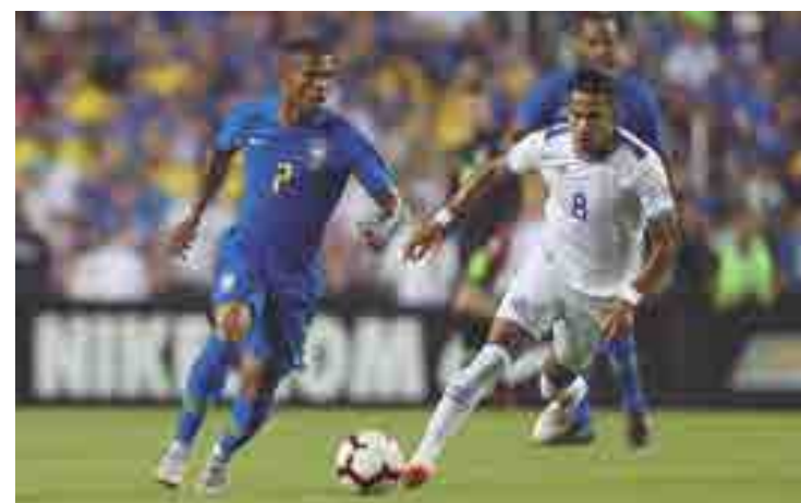
O Brasil não encontrou dificuldades para golear o El Salvador por 5 a 0

deu sobre o que mais ficou contente com os seus comandados.