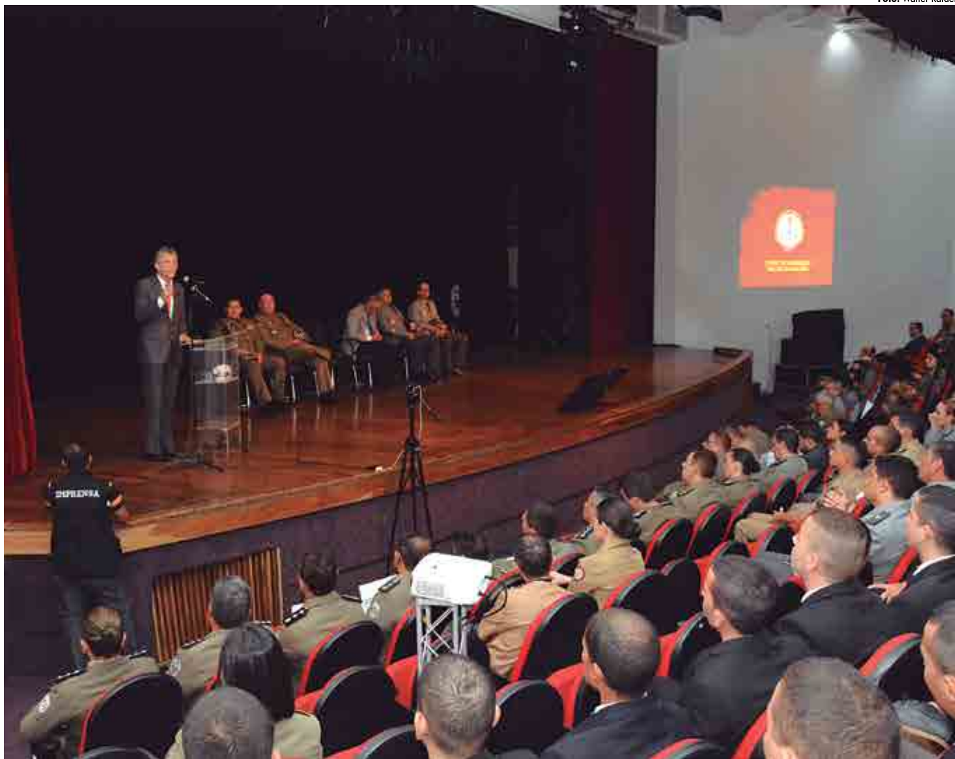
Aula Magna foi proferida pelo governador Ricardo Coutinho no auditório do Garden Hotel, em Campina Grande, com a presença das autoridades das forças de segurança da Paraíba