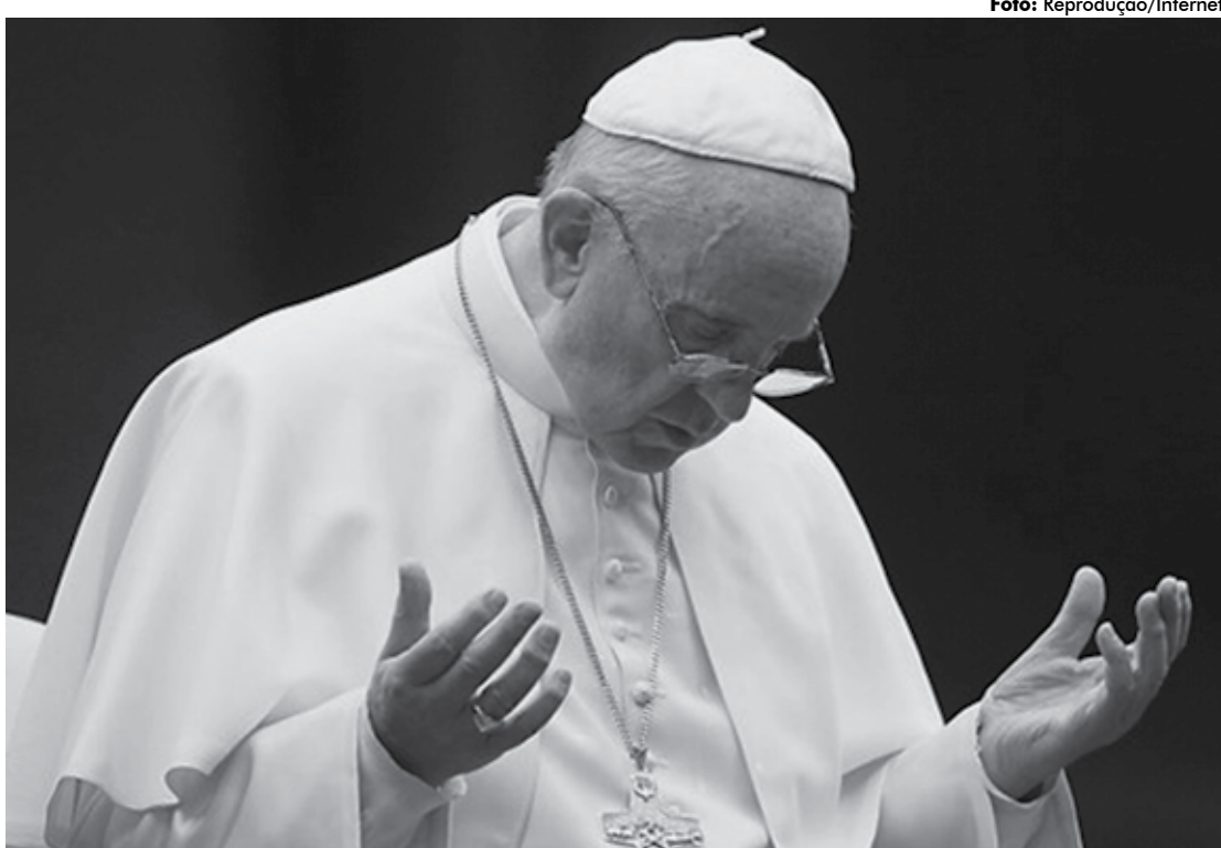
O papa Francisco vem enfrentando uma série de problemas na Igreja, a exemplo de pedofilia e desvio de recursos

O relatório parte da base que, junto aos casos documentados, existe um "número obscuro" de muitas outras situações de abu-