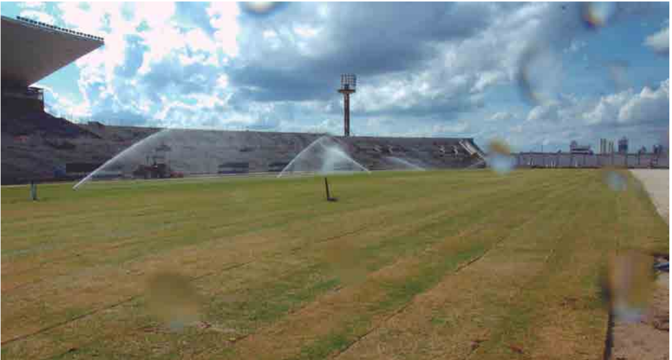
O moderno gramado do Amigão, idêntico aos usados nos estádios que sediaram recentemente a Copa da Rússia, já está em fase de conclusão, com o plantio final da grama e os testes do moderno sistema de irrigação